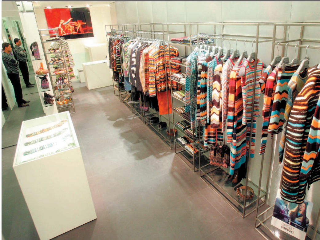
Das Architektenteam CLS aus Mailand stiehlt den bunten Textilien mit zurückgenommene Design nicht die Schau

Die Missoni-Boutique im ersten Bezirk hat gleich gegenüber Verstärkung bekommen: Missoni Sport, die Zweitlinie mit gewohnt bunter, aber leistbarer Alle-Tage-Mode.